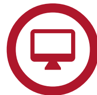
Blackline Live™ -verkkoportaali