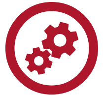
Helppo tuloliitännän määrittäminen